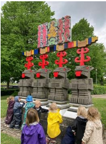
Vi har igen kunne besøge de mange omkringliggende kulturtilbud.