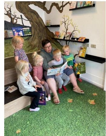
Og blandt meget andet, har mange besøgt biblioteket.