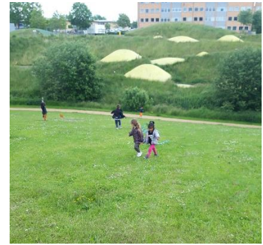
Vi eksperimenterer stadig med sjove aktiviteter. Kan dragerne flyve?