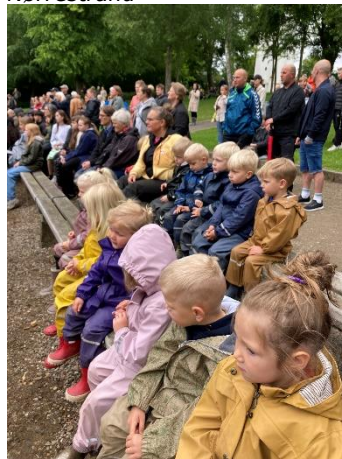
Mange grupper var til koncert i Lunden.