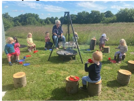
Vi har stadig et stort fokus på gode og sjove udendørs aktiviteter. Bål, ture og cykelture "ud i det blå" samt leg og aktiviteter på legepladserne og ved Nørrestrand