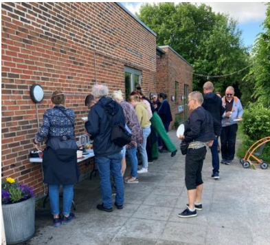
Vi har igen haft forældrekafe, bedsteforældredag og forældremøder. Det har været skønt at se jer igen 😊