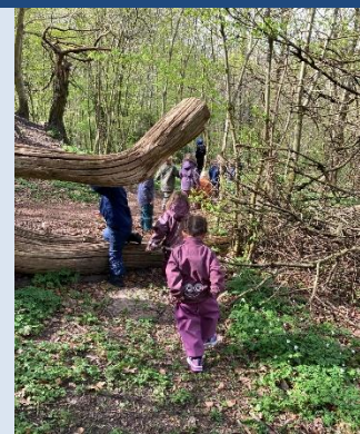
Anemoner i skoven