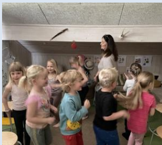
Afslutning for skolebørnene