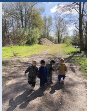
Cykeltur med madpakker