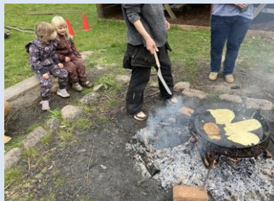
Pandekager på bål