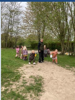
Fællesleg ved Nørrestrand

Der er rigtig god stemning i alle huse og børnene udnytter at der er god plads.