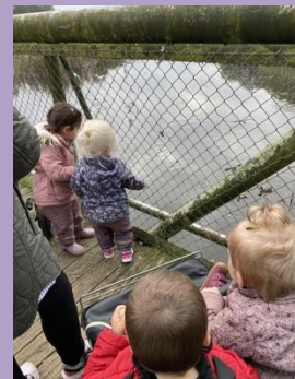
Vi fodre ænder