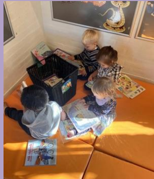
Vi læser bøger