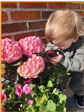
Blomsterduft og sanselighed