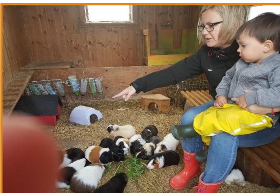
Nærvær, fordybelse, nye ord, samtale oplæsning, fælles fokus, sproglig fokus.

Børns sprog udvikles i dialoger med sproglige rollemodeller ved at lytte, fortælle, stille spørgsmål til deres omgivelser og ved at lege med sproget. Når børn eksperimenterer kommunikativt og sprogligt, opnår de erfaringer med at aflæse, genskabe og udvikle en passende kommunikation i forskellige situationer og fællesskaber. Det betyder bl.a., at det pædagogiske personale må hjælpe alle børn til at indgå i dialoger, hvor de lærer at skiftes til at være i en tale- og en lytteposition.