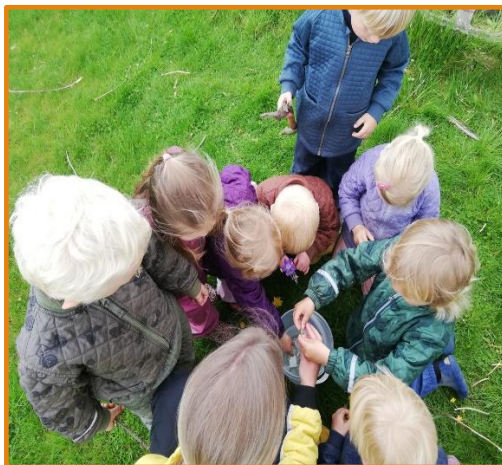
Hvad kan mælkebøttestænglen