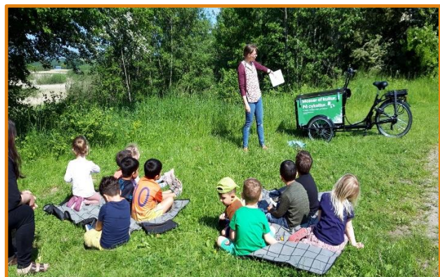
Kultur, natur, cykeltur,