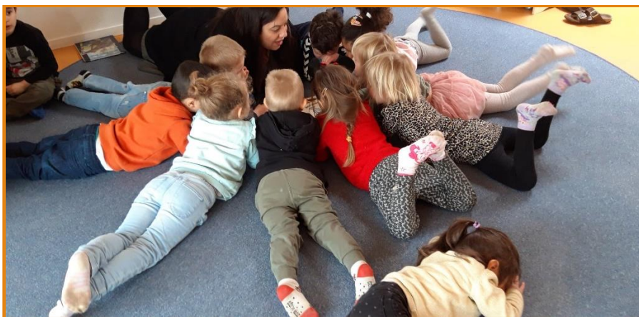
Opmærksomhed, sprog, fællesskab, ihærdighed, lytte.