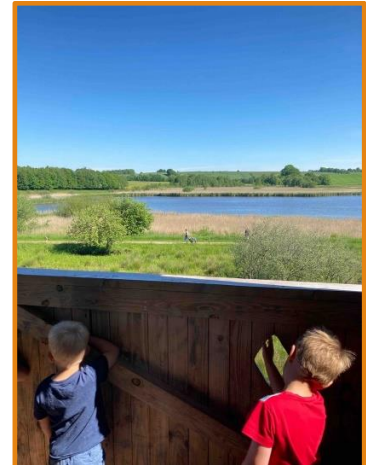
Besøg i fugletårnet