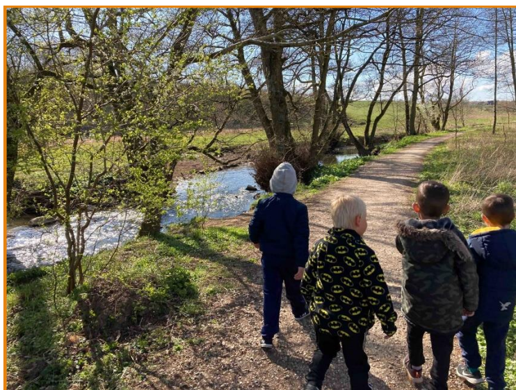
Udholdenhed, 10 km gåtur, venner, naturoplevelse