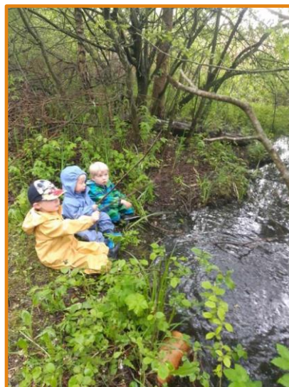
venner, fisketur og leg