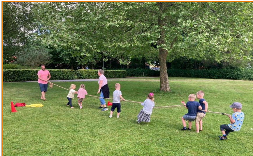
Sjov og ballade, hvem vinder, kropslig udfordring.