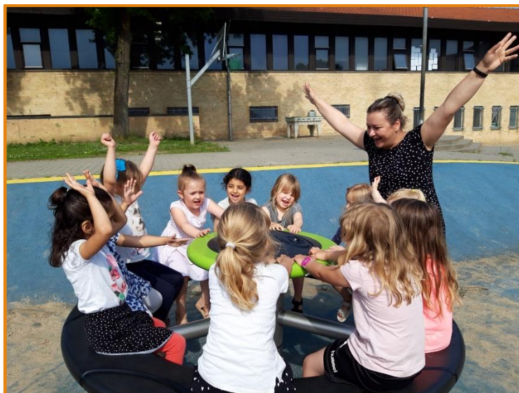
Glæde, fællesskab, venskab, sjov, mestring, sansestimulation.