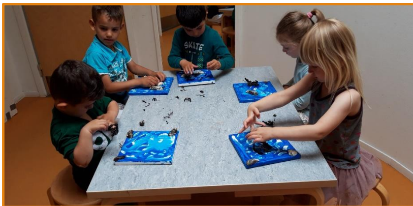
Kunst med strandfund, samarbejde, flot 😊