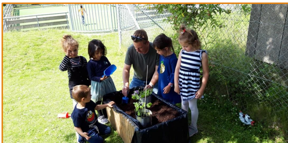
Samarbejde, mestring, sprog, fordybelse.