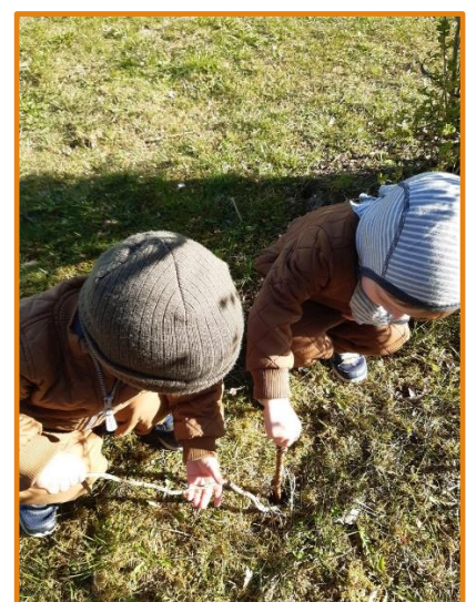
fællesskab og samarbejde