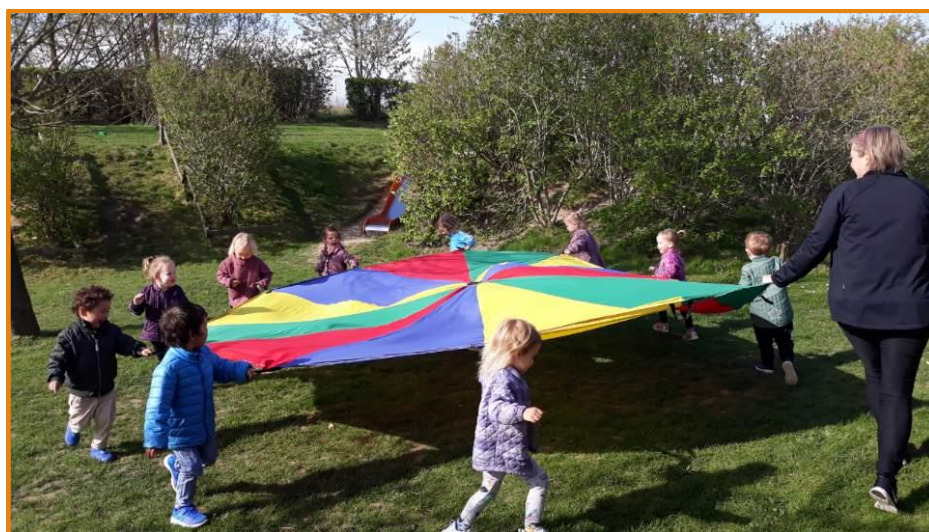
Fællesleg, læring, sjov og godt humør☺