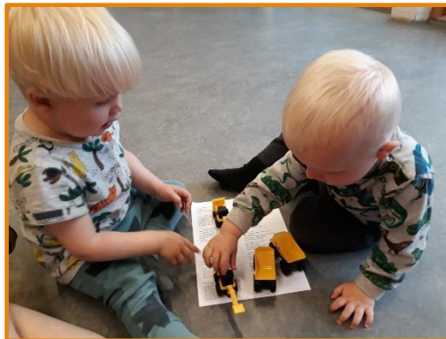
Venner, leg, udsætte egne behov.

Børn i dagtilbuddet skal deltage i sociale fællesskaber, hvor de oplever at høre til, og hvor de kan bidrage værdifuldt og relevant til fælles lege, aktiviteter og samvær. Alle børn, og særligt børn der længerevarende befinder sig i udsatte positioner, er afhængige af, at det pædagogiske læringsmiljø opfatter forskellighed som en ressource og understøtter muligheden for deltagelse og medindflydelse til fælles glæde og engagement.