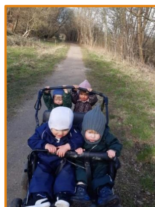
Tur med vennerne, sjov og motorik