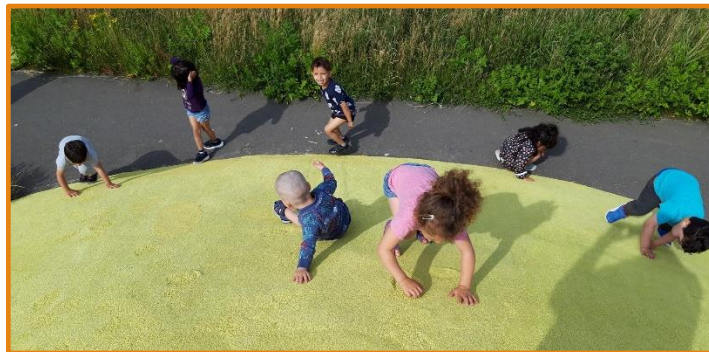
Vi øver os, venner, fællesskab, kropslig læring, det er sjovt ☺

Børn er i verden gennem kroppen, og når de støttes i at bruge, udfordre, eksperimentere, mærke og passe på kroppen - gennem ro og bevægelse - lægges grundlaget for fysisk og psykisk trivsel. Kroppen er et stort og sammensat sansesystem, som udgør fundamentet for erfaring, viden, følelsesmæssige og sociale processer, ligesom al kommunikation og relationsdannelse udgår fra kroppen.