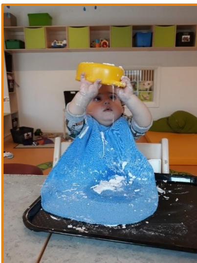
Nysgerrig, leg, eksperiment

Vi arbejder løbende med at kvalificere vores hverdagsrutiner og læringsmiljøet fra kl.7-17.