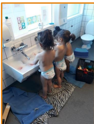
Venner og vandleg

Vi vil anvende forskellige relevante evalueringsmetoder i løbet af året.