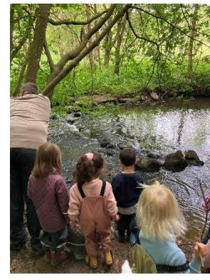
Masser af ture til skoven, strande og Nørrestrand, masser af udfordringer, masser af sjov, leg og fællesskab 😊