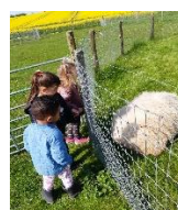
Tur til Børnebondegarden

Vi har igen i år været heldig at kunne komme på tur med naturbussen i maj og juni og turen går også ud i det blå i august og september 😊