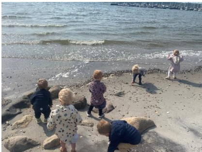
Vi har et stort fokus på de gode legefællesskaber og børnefællesskaber. I vuggestuen og dagplejen elsker børnene en tur til stranden som heldigvis ligger tæt på.

Her er et par billeder af hvad vi har lavet i løbet af foråret 2024. Alt sammen med et særligt fokus på de gode og sjove børnefællesskaber.