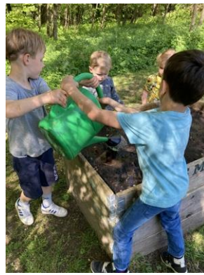
Der bliver plantet mange steder. Her er det i Skovbørnehaven, hvor børnene hjælper til og tager ansvar for at planterne bliver vandet.