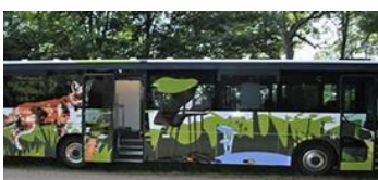
En af Horsens kommunes naturbusser med bla. toilet og køkken.