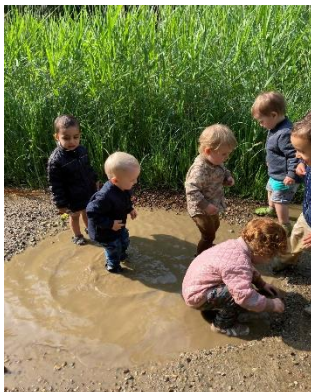
Vidunderlige vandpytter 😊