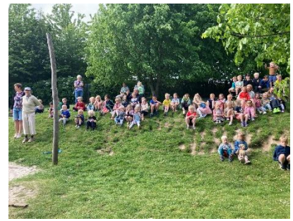
Fællessang på bakken. Børnene sang for Bedsteforældrene, da de var inviteret til at plante en sommerblomst med deres barnebarn.