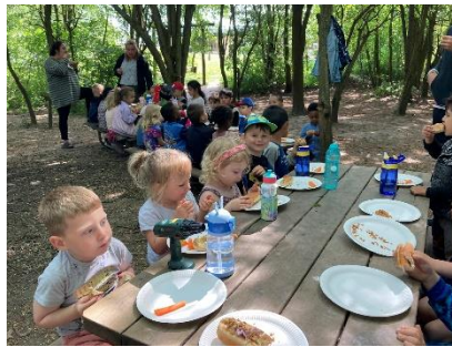
Vi har stadig et stort fokus på gode og sjove udendørs aktiviteter. Bål, ture og cykelture "ud i det blå" samt leg og aktiviteter på legepladserne og ved Nørrestrand. Her spiser børnene hotdogs med gulerødder tilberedt på bål.