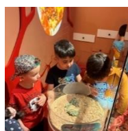
Tur til Økolariet i Vejle